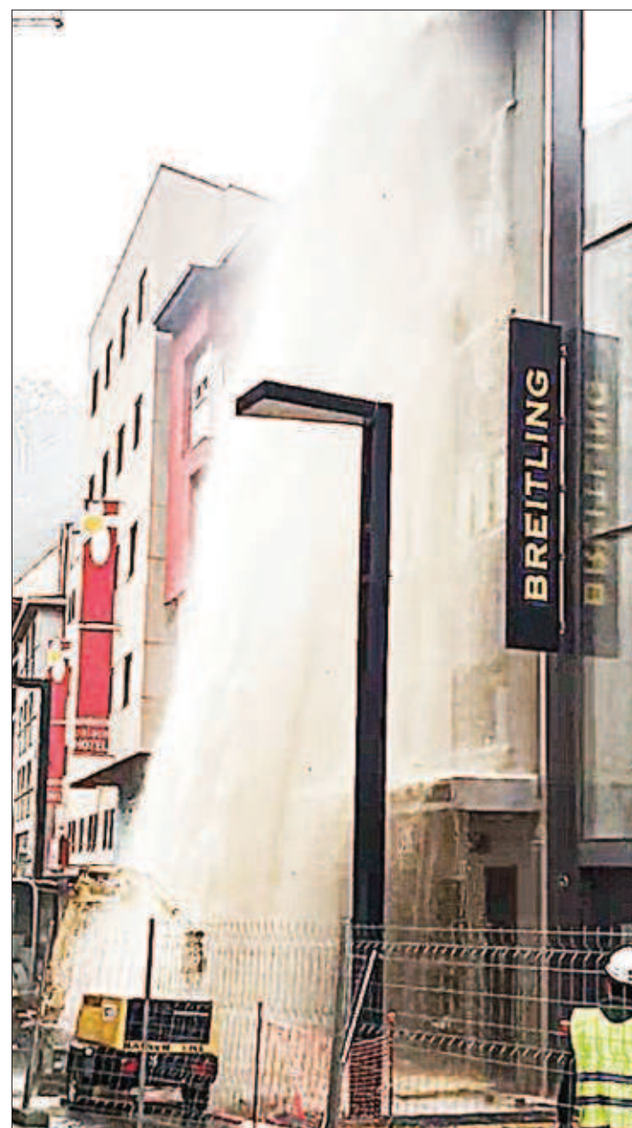
L'aigua surt a pressió de la canonada rebentada.

VAN ACTUAR TRES VEHICLES DELS BOMBERS PÀGINA 14