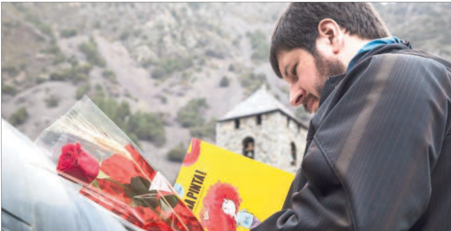
El llibre i la rosa, novament protagonistes d'una jornada quasi festiva amb epicentre a la plaça del Poble, amb la icònica imatge de Sant Esteve al fons.

ELS ESCRITORS DE CASA ES REPARTEIXEN LA MAJOR PART DEL PASTÍS