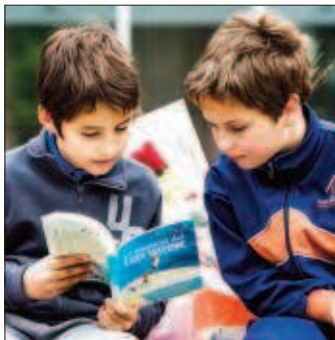
Dos nens llegeixen un llibre.